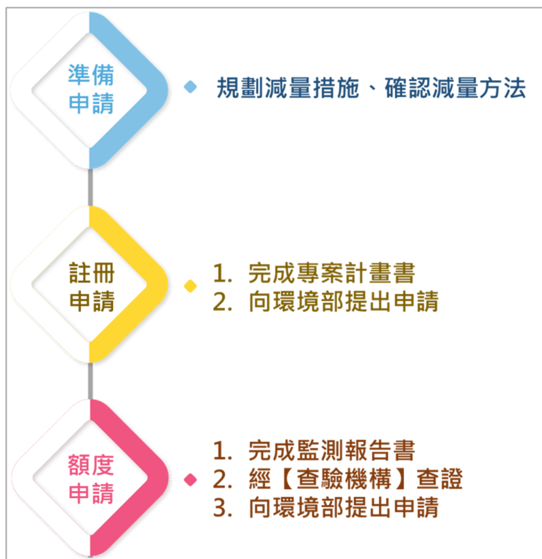
圖 2、自願減量專案申請流程

事業或各級政府為取得自願減量專案減量額度，應自行或共同依本辦法規定提出申請，檢具使用中央主管機關審定公開溫室氣體減量方法之專案計畫書及相關文件，向中央主管機關申請註冊，經審查通過後據以執行，於執行完成提出監測報告及相關文件，經中央主管機關審查核准具實際減量成效後取得減量額度。