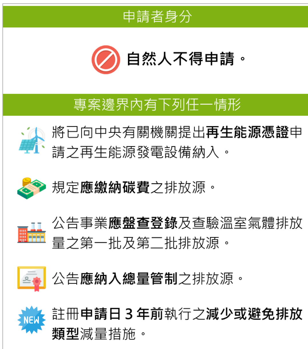
圖 1、不得申請自願減量專案之情形

依據管理辦法第 3 條規定，事業或各級政府可以自行或共同依本辦法規定提出自願減量專案申請，其中事業係指公司、行號、工廠、民間機構、行政機關（構）等。